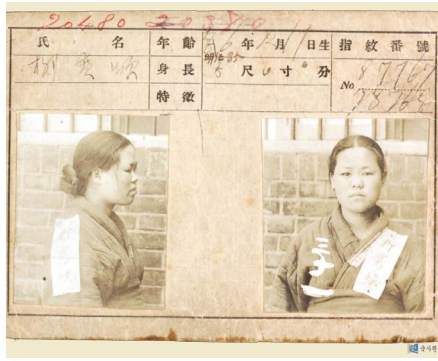
이화학당 시절의 유관순(좌)과 수감기록증(우)

최근 일부 교과서에서 그 이름이 사라진 유관순 열사에 대한 관심이 세간에 다시금 고조되고 있다.